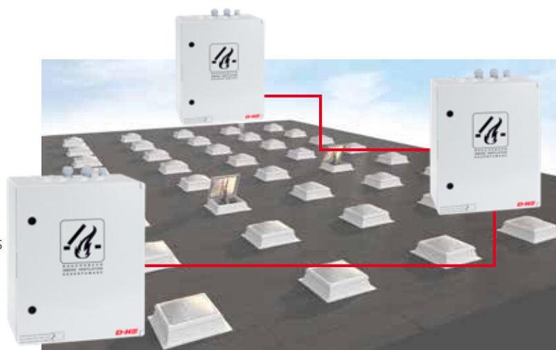
Várias centrais interligadas numa única rede através da opção Main/Sub